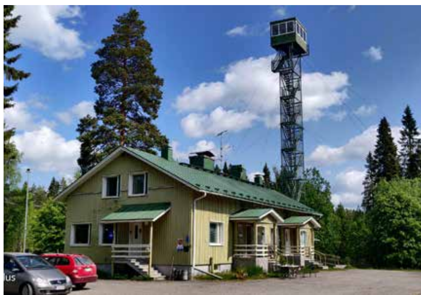
Raatteen majatalo Suomussalmella.