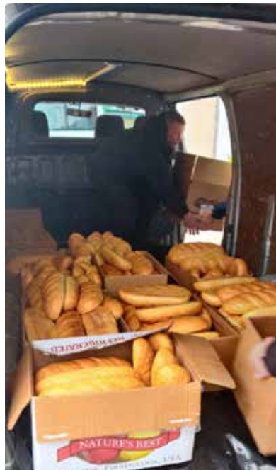
Leipäkuljetus matkalla Odessaan.

Keväällä 2022 yhdistyksen silloinen sihteeri vieraili Kirgiisiassa.