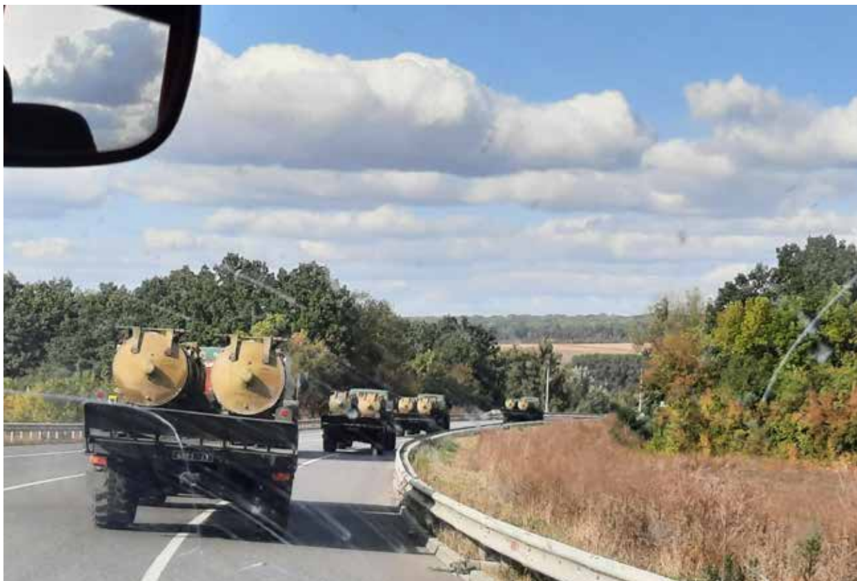
Ohjusten siirtoa siellä jossain. Emme pitkään viiptyneet saattueen perässä, sillä ajattelimme sen olevan hyvä kohde.

tä: ”Nukuitteko hyvin?” ”Kyllä!”, vastasimme. He näyttivät itse kuvattua videota yön ilmapuolustuksesta. Päiväsaikaan ihmisillä ei näyttänyt olevan sen suurempaa paniikkia sodasta. Kaupungeissa nuoret menivät kouluihin ja aikuiset töihin.