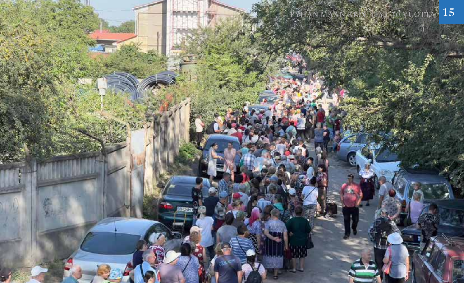
Ihmisiä jonottamassa Odessassa.