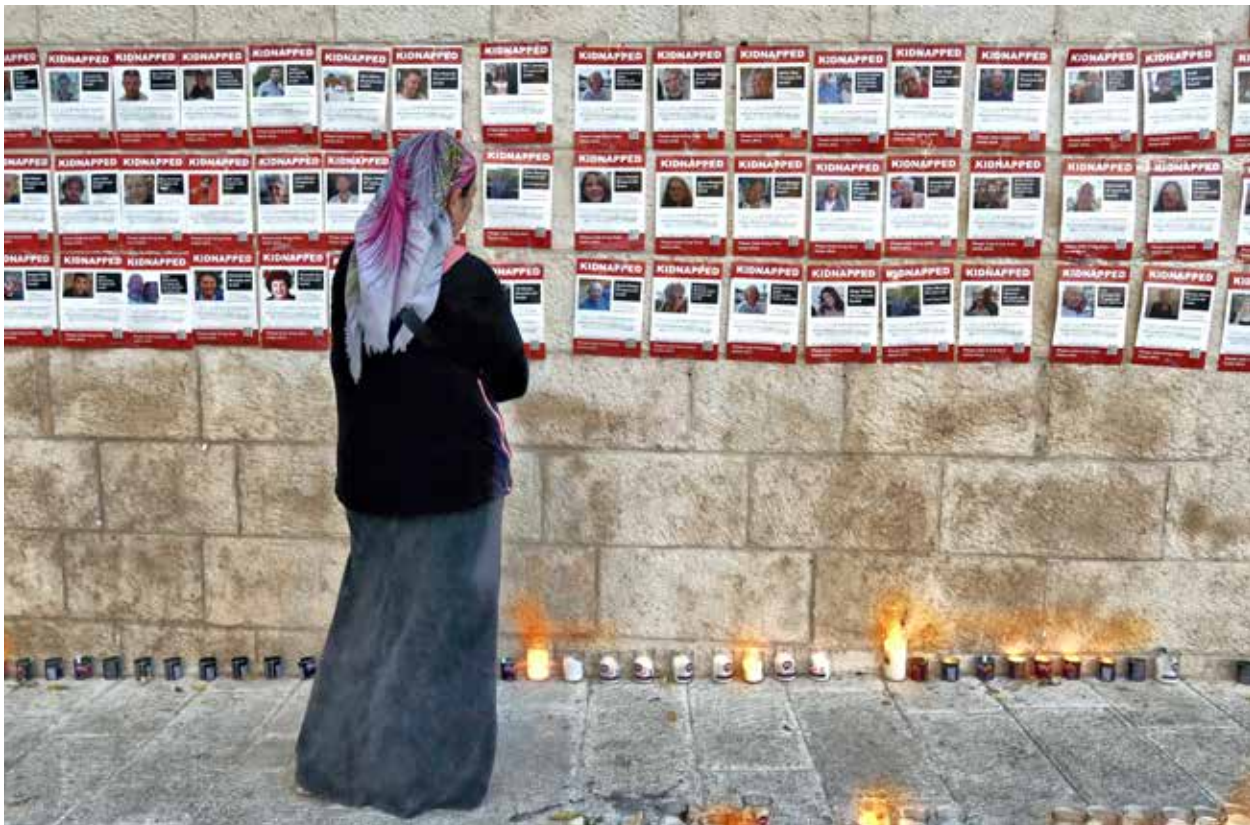
Ihmiset ovat tuoneet kynttilöitä muurin ääreen, johon on koottu ilmoituksia kidnapatuista ihmisistä.