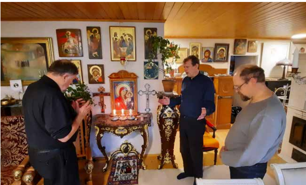
Varjeluksen pyytäminen 10 päivän Ukrainan matkalle ei ollut pahitteeksi. Menimmehän sotaa käyvään maahan.

Eräänä yönä Odessan kaupunkiin tuli 36 dronea, joista osa oli lennokkeja. Kymmenkunta oli päässyt läpi. Ystävät kysyivät mei-