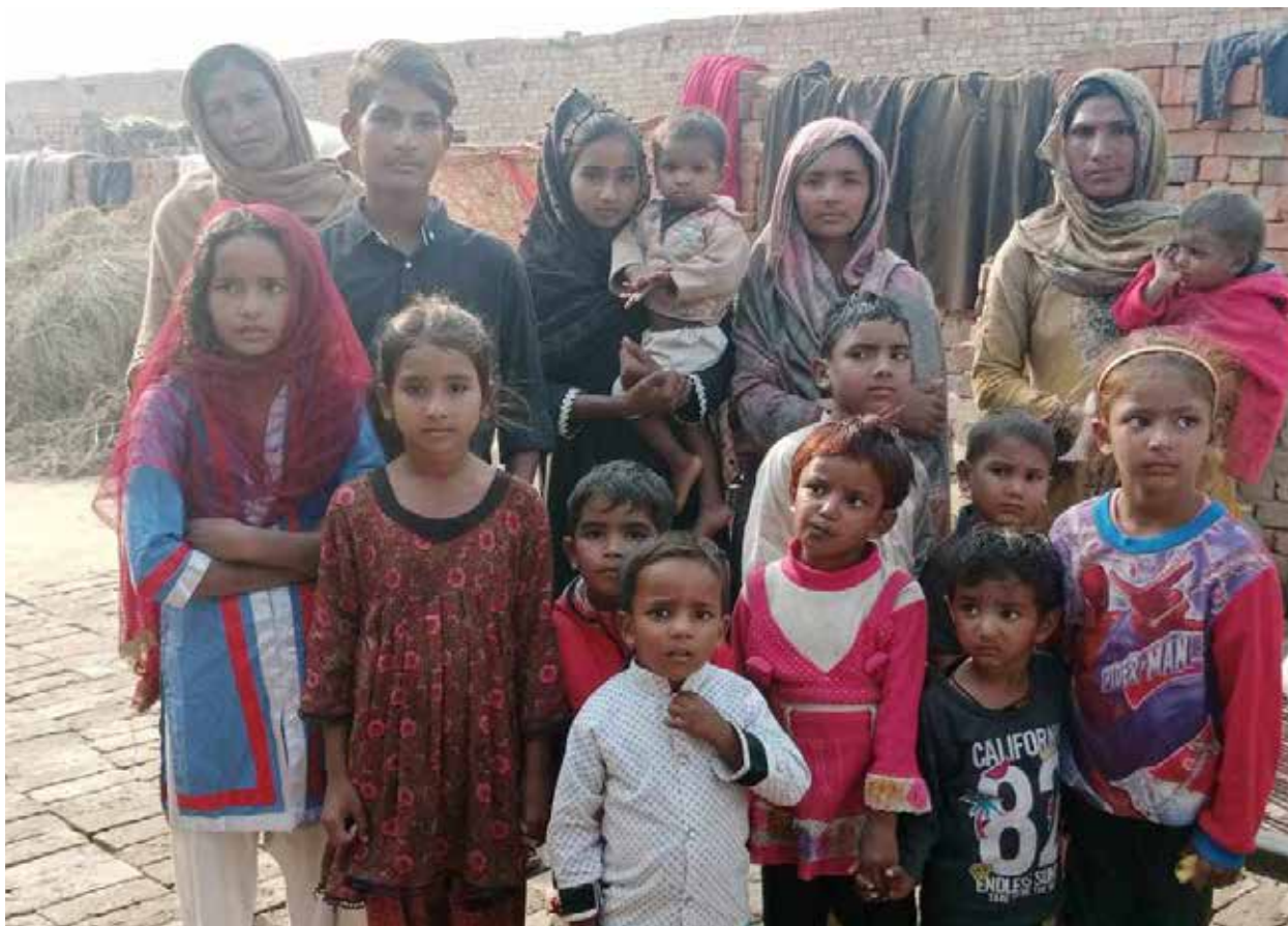
Suomalaiset ystävät opettavat viikoittain pakistanilaisia opetuslapseskoululaisia.